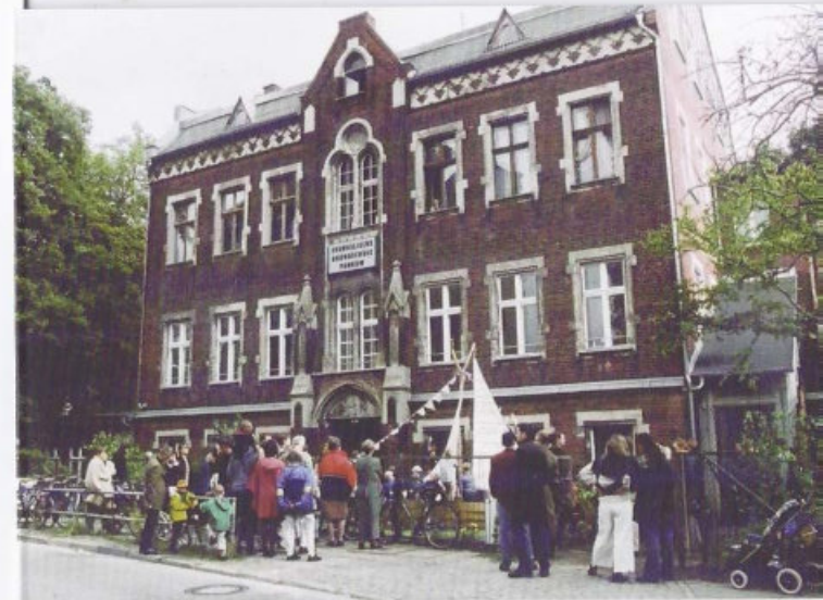
Eröffnung der Schule in der Hadlichstraße am 08.09.2001